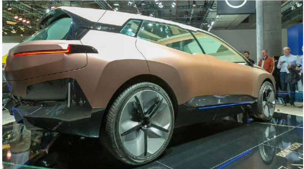
Imagen: Flickr , por Marco Verch. Detalles de la licencia.